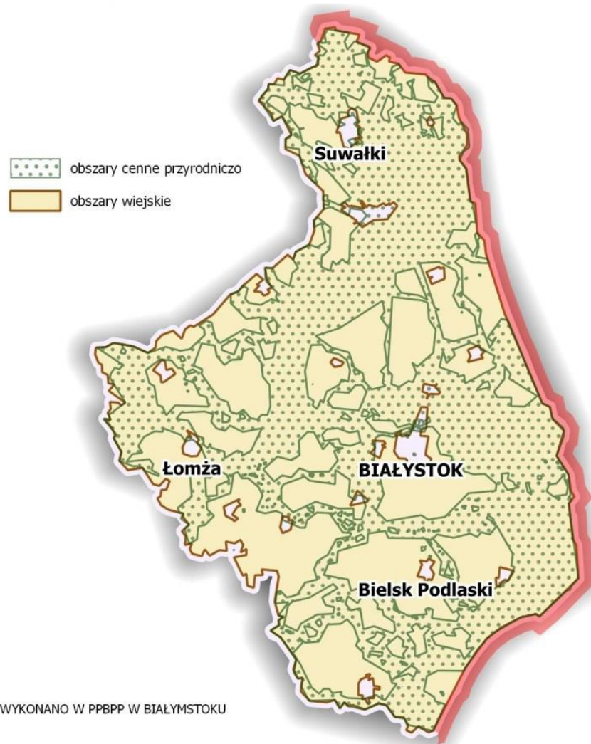
Rysunek 2. Obszary wiejskie w województwie podlaskim, w tym przyrodniczo cenne